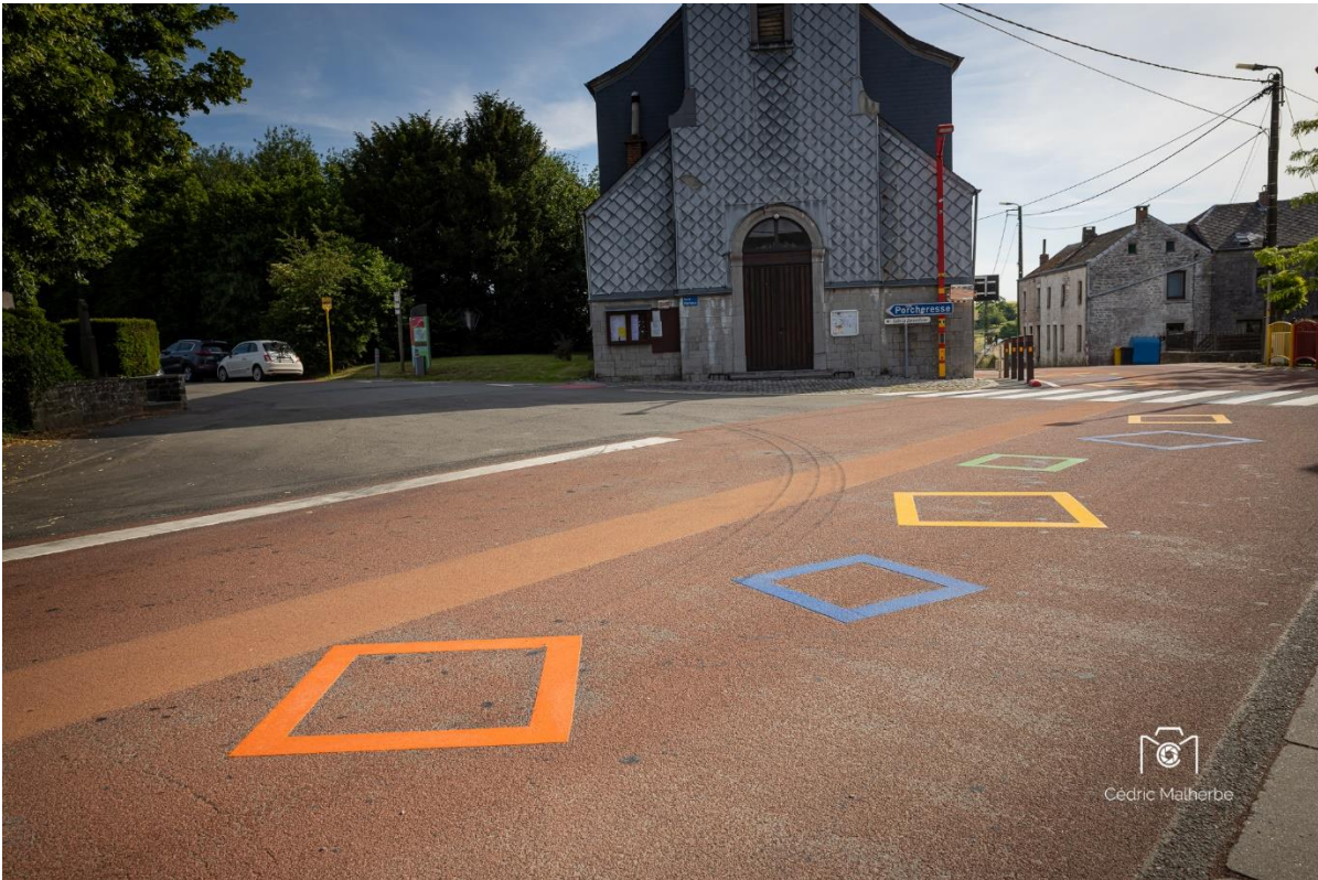
Marquage au sol Ecole fondamentale Barvaux-en-Condroz

Une première école bénéficie déjà de ce nouveau marquage au sol. Il s'agit de l'Ecole fondamentale de Barvaux-en-Condroz située route de Dinant, 23.